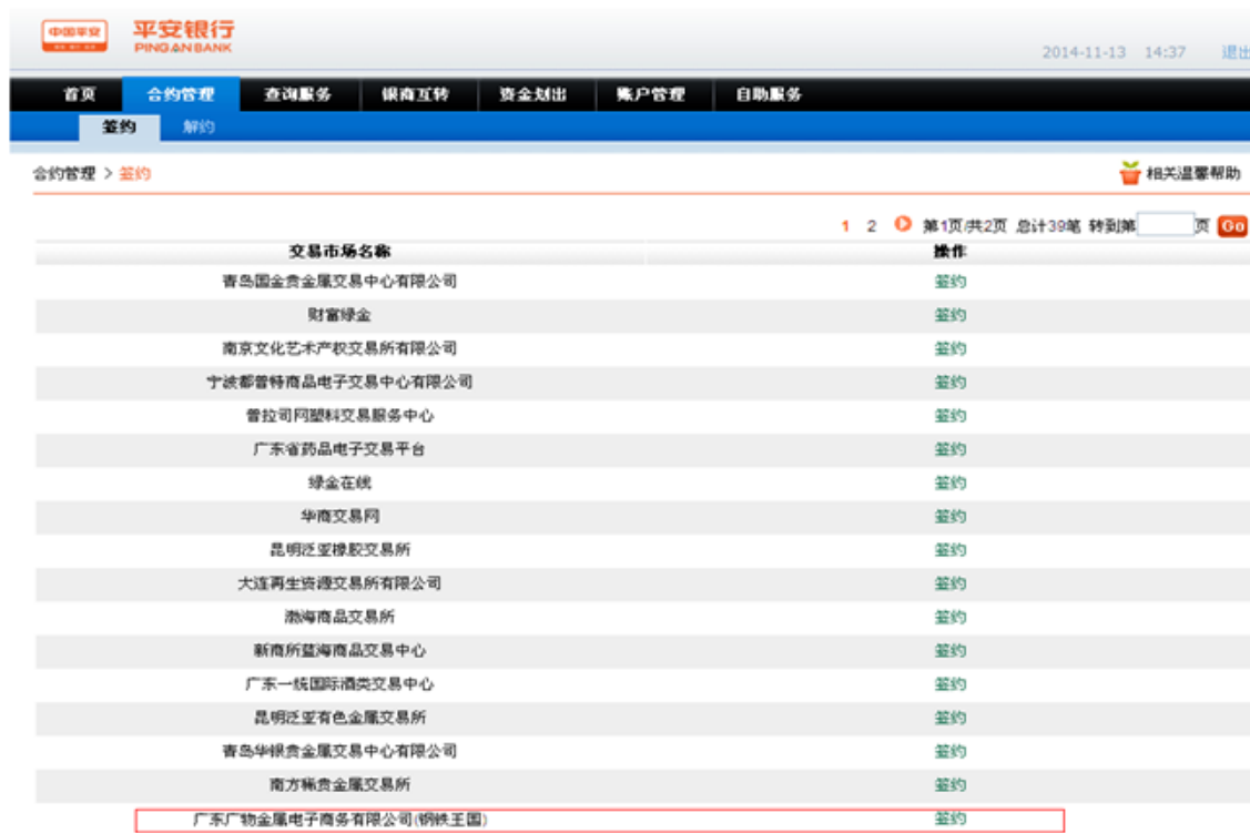
上图：平安易宝绑定钢铁王国截图一

首先，登录平安易宝后，进入签约页面，选择“钢铁王国”进行签约绑定。绑定时需输入“会员代码”，“会员代码”可以在钢铁王国“会员中心”查询。如以下各截图所示：